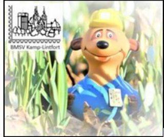
Bildpostkarte 2019 / 55 Jahre BMSV