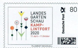
Ganzsache (Brief) 2019 – LAGA 2020 mit Zudruck Asdonkshof