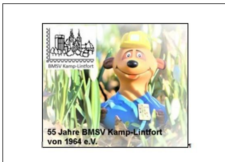
Ansichtskarte 2019 / 55 Jahre BMSV