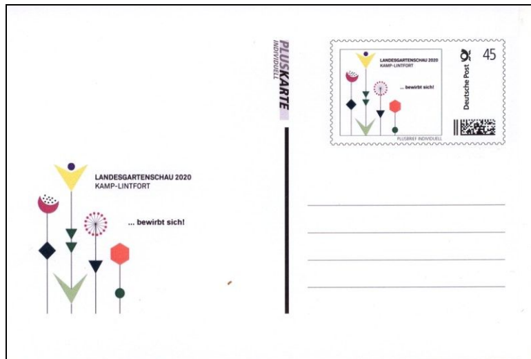
Ganzsache 2015 / Bewerbung LAGA 2020