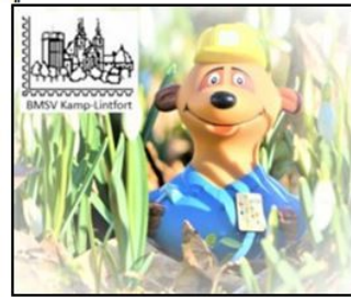
Briefumschlag 2019 / 55 Jahre BMSV